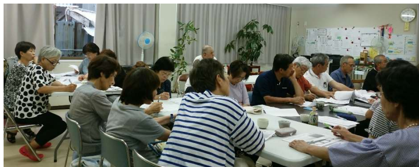
夢まちランドボランティアスタッフ会