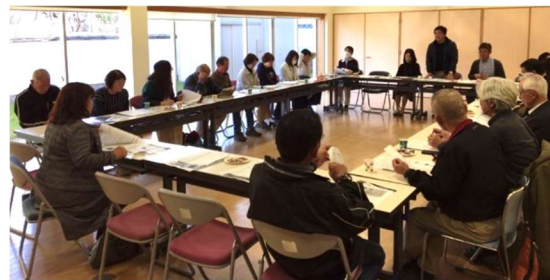
みんなで福祉のまちづくり委員会正副会長会