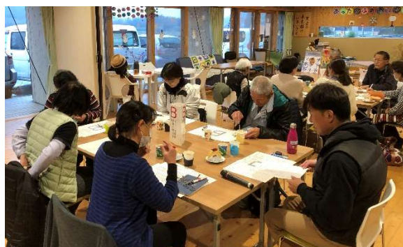
見守りネットワーク