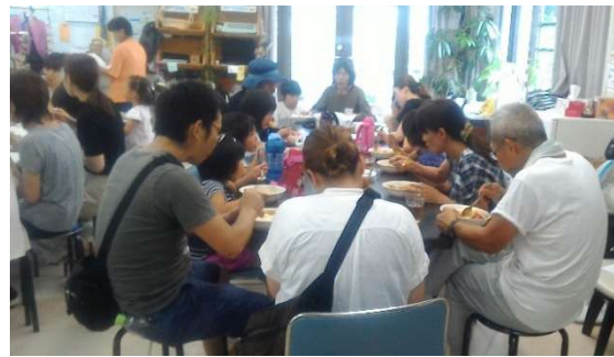
夏休み親子工作教室