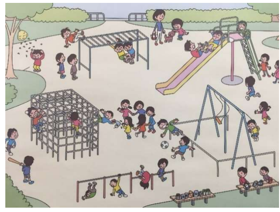
危険予知トレーニングの設題2