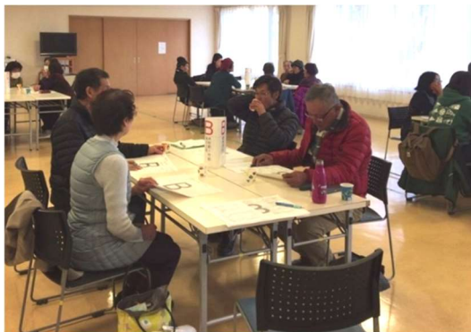
佐川西 2 地区