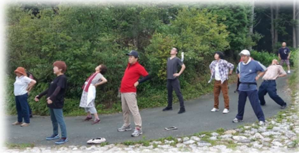
「牧野公園へ早朝ウオーキンググループ」