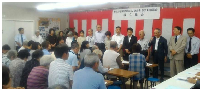
NPO 法人さかわ夢まち協議会 設立総会