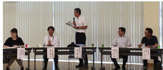
みんなで福祉のまちづくり委員会総会