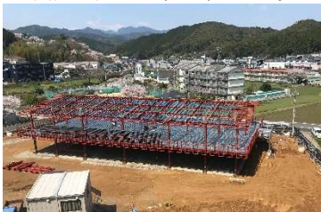
建設が進む地域共生交流拠点ぷらっとホーム 3/31