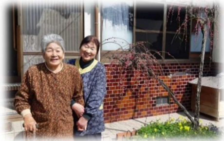
「しゃべって笑っていきいき元気」

地域の支え合い活動の情報収集をはかるとともに、その内容を社協の広報誌へ紹介をし、見える化を行った。